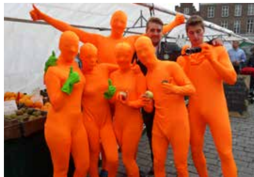
▲ Foto: Upgraders in actie voor 'De Groene Handdruk'

Het programma Consumptie Verplicht! werd mede gefinancierd door het ministerie van Buitenlandse Zaken (via de SBOS-regeling). Switch gaat in 2015, maar dan zonder SBOS-gelden, verder met het jongerenprogramma.