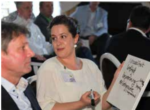
▲ Kennisquiz met ondernemers op een Tasty10 bijeenkomst.

Het project Tasty10 werd mogelijk gemaakt door financiering van Oxfam/Novib.