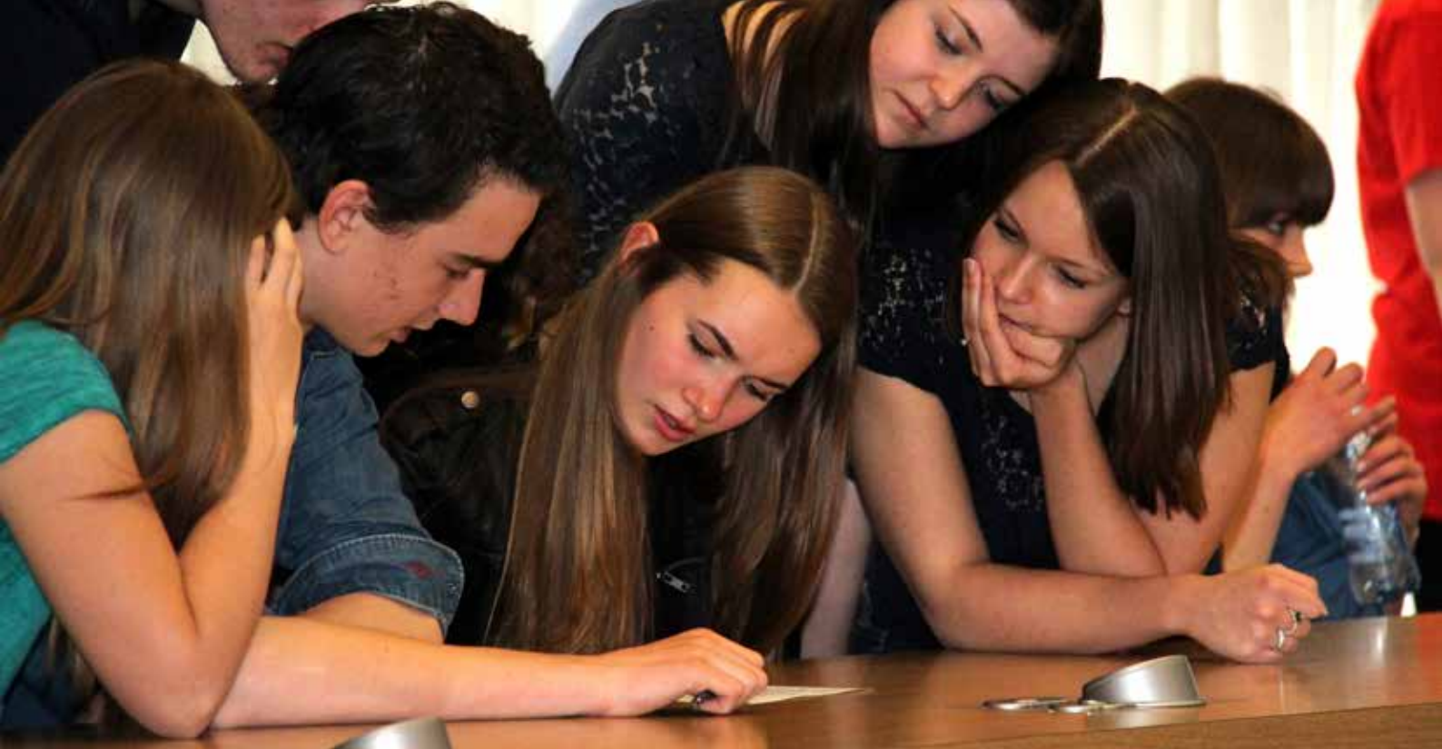
▲ Leerlingen overleggen tijdens de Scholierencompetitie in Tilburg.