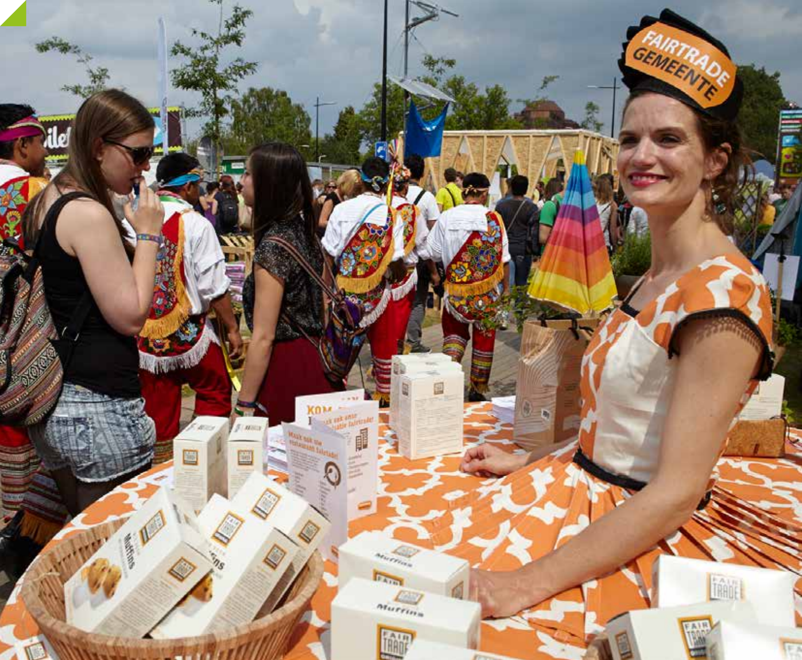
▲ Fairtrade campagne voeren tijdens Festival Mundial.