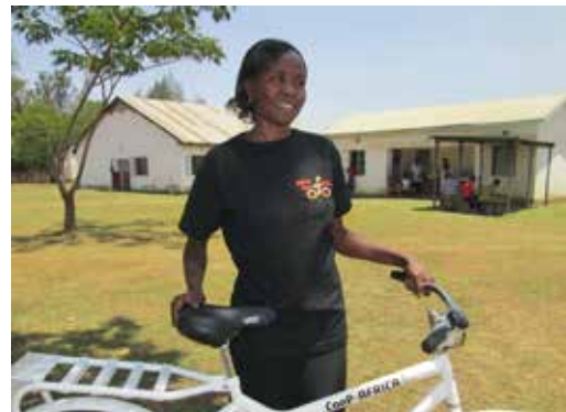
▲ Gezondheidswerker gebruikt Bike4Carefiets om patiënten te bezoeken.

De campagne biedt werkgevers een kans om concreet invulling te geven aan hun duurzaamheidsbeleid. Tevens kunnen de werkgevers duurzame projecten in ontwikkelingslanden sponsoren door een bedrag per gefietste kilometer bij te dragen. In 2014 fietsten de deelnemers van Fietsen Scoort bijna 9 miljoen kilometer, oftewel 225 maal de wereld rond. Hierdoor kwam 1,4 miljoen kilo CO 2 niet in de atmosfeer terecht, hebben deelnemers flink geld bespaard, gewerkt aan hun eigen gezondheid en de mondiale voetafdruk verkleind. In 2014 is bovendien € 39.000 bijeen gefietst voor duurzame projecten in ontwikkelingslanden. Dit geld gaat naar ontwikkelingsorganisaties, in het bijzonder naar Cycling out of Poverty dat verschillende fietsprojecten uitvoert in Afrika.